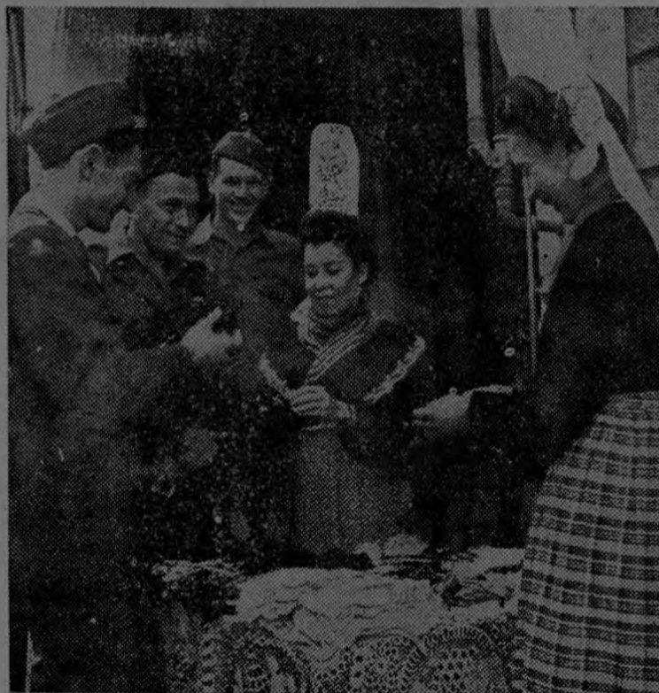
Antes de salir de Francia los G. I. americanos compran a estas bretonas ataviadas con sus pintorescos trajes regionales, guantes y encajes para sus familiares y para sus novias.