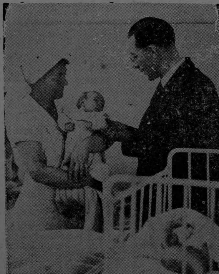
Como buen Ministro de Sanidad y Población el señor Robert Prigent visita periódicamente las maternidades de Francia. Estas criaturitas son el porvenir de la nación y se les cuida con especial interés y cariño.