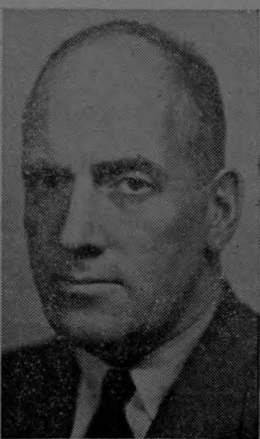
Wallace K. Harrison

El Secretario de Estado tendrá el deber de velar por el fiel cumplimiento de los compromisos contraídos por dicha oficina con las otras repúblicas americanas, en los ramos de higiene, saneamiento, provisión de alimentos, educación y transportes—los cuales tienen el propósito de mejorar las condiciones de vida en el Hemisferio Occidental.